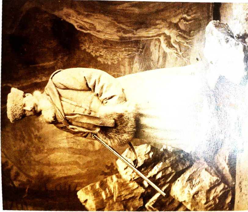
1876 - 1882. Saint-Petersburg. Costantino Nigra. «Un recueil sincère des mots et des formes qui sont indigènes dans la vallée, tels qu'ils sont prononcés par les humbles gens [...] et par ceux qui sont, comme les prêtres avec le petit peuple» . 1876-1882. San Pietroburgo. Costantino Nigra. (Comune di Castellammone - Biblioteca Civica "G. Pisanelli", raccolta privata di Costantino Nigra)