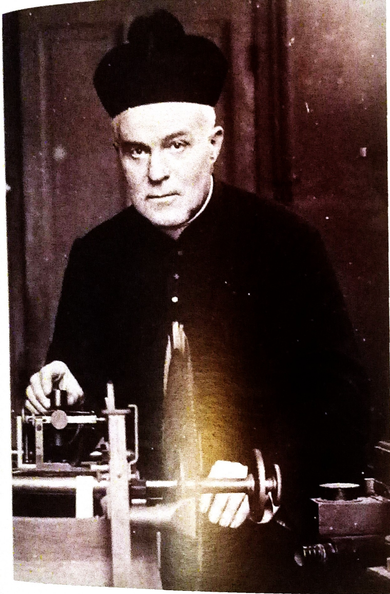
Jean-Pierre Rousselot

Glottologo di formazione, egli è considerato il fondatore della fonetica sperimentale francese: grazie a lui, questa disciplina riesce a conquistare una propria autonomia in rapporto alle altre branche delle scienze del linguaggio. Fondatore della "Revue de phonétique" e della "Société des parlars de France", egli fu anche direttore della "Revue des patois gallo-romans" e della rivista "La parole". Nel corso della sua vita, si occupò della promozione degli studi di fonetica sperimentale e di glottologia presso diverse associazioni intellettuali francesi e nell'ambito universitario.