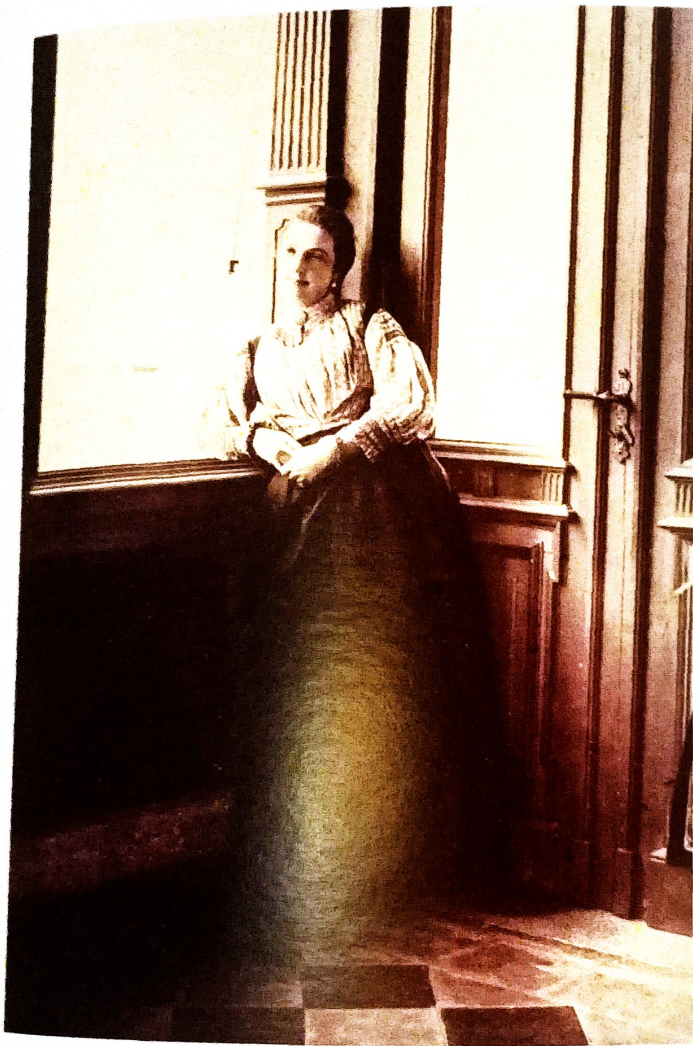
1889 Villa Margherita. La reine Marguerite