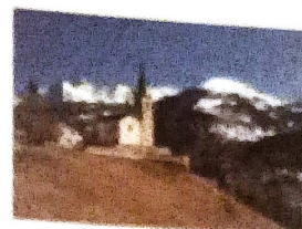
Centre d'études Francoprovençales RENE WILLIEN