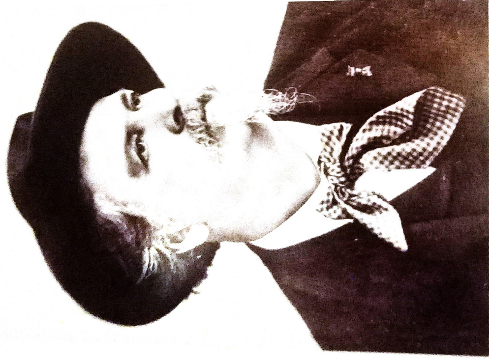
Frédéric Mistral / Ardezan Cumbuscario Centre Provençal Frédéric Mistral / Ardezan Cumbuscario Centre Provençal

Il 21 maggio 1854, Mistral, Roumanille e altri cinque giovani poeti di Avignone fondarono a Font-Ségugne il Felibrige , un'associazione che raggruppava "i moderni troubadours " e che aveva come obiettivo quello di salvaguardare, illustrare e promuovere la lingua e la cultura specifica dei paesi d'oc. Scrittore e lessicografo, Mistral si dedicò alla realizzazione de " Lou Trésor dou Felibrige " che rimane, ancora oggi, il più ricco dizionario di lingua provenzale. Infine, nel 1904, egli vinse il premio Nobel per la letteratura per aver rappresentato nelle sue opere poetiche " la natura e la vita popolare della Provenza " e per i suoi studi di filologia.