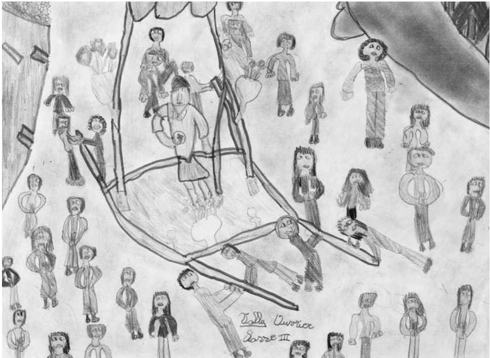
La procession de Saint-Besse vue par les enfants de Cogne-Épinel, 33 e Concours Cerlogne.