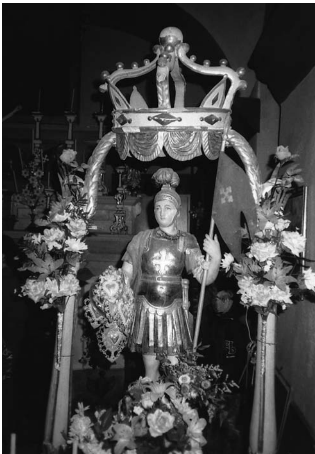
Photo tirée du 33 e Concours Cerlogne, école primaire de Cogne-Épinel.

La légende officielle fait de saint Besse un soldat de la Légion thébaine massacrée en 286 sur l'ordre de l'empereur Maximien. Besse s'échappe et se réfugie dans les montagnes dont il évangélise les habitants. Mais il est précipité du haut d'une roche par des bergers, car il a refusé de manger d'une