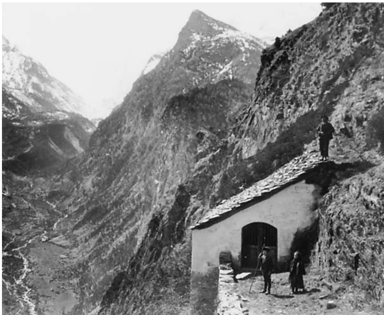
Fénis, 12/4/1912. Le sanctuaire de Saint-Julien